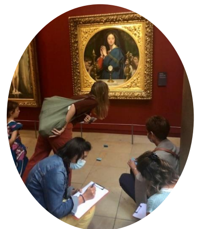
les stagiaires de la Promo 14