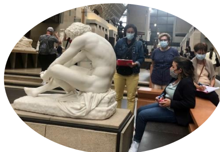
Collage réalisé par Annick TORRES, inspiré de la visite au musée