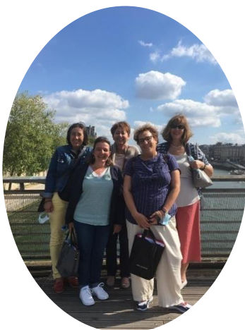
Visite au Musée d'Orsay avec