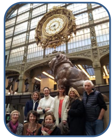
Visite au Musée d'Orsay afin d'expérimenter les techniques de CLEAN avec la Promo 9